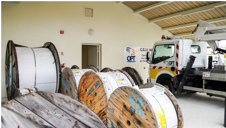
Aire de stockage doublé permettant d'abriter un camion nacelle ainsi que des tourets de câbles, dont le câble sous-marin international.