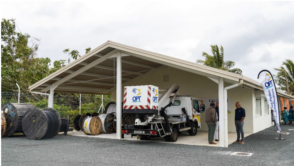
La nouvelle unité de service délocalisée de Tadine à La Roche

Afin d'assurer ses missions sur l'ensemble du territoire, la direction des télécommunications de l'OPT-NC compte 7 unités de service (US) ayant à charge la production et la maintenance des diverses installations techniques.