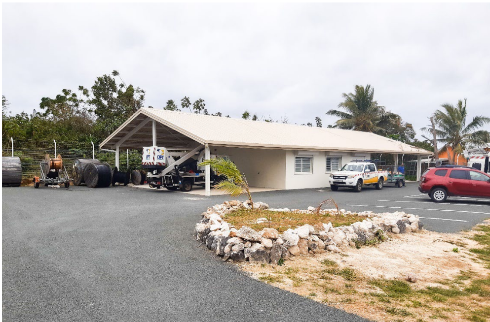
Le nouveau centre technique de La Roche