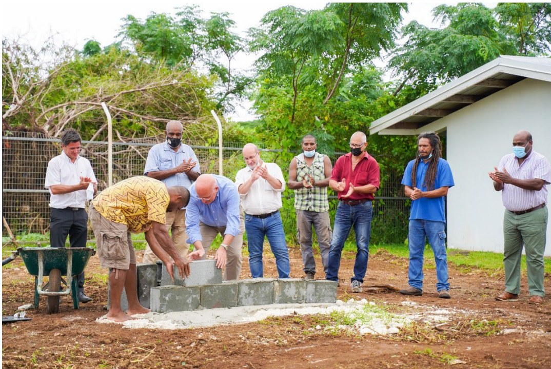
Février 2022 : pose de la première pierre de l'unité de service de La Roche

Le coût global de l'opération s'est élevé à plus de 95 millions FCFP , dont 80 millions pour la partie travaux.