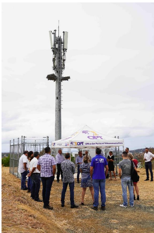
Le site mobile de Koutio-Dumbéa a été mis en service le 13/07/2018 et la 4G+ a été installée le 22/11/2019.

Plusieurs prestataires, dont INTELIA, ont été pilotés par l'OPT-NC dans le cadre de cette installation et de toutes les autres réalisées sur le territoire.