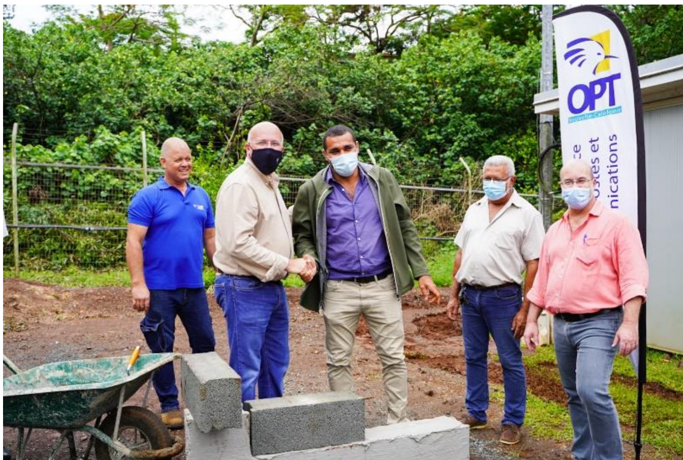
Pose de la 1 ère pierre de l'US.