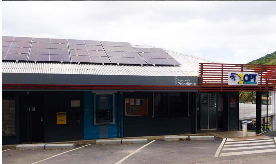
Façade de l'agence Poindimié avant et après les travaux

Les travaux engagés pour la rénovation de l'agence ont permis les améliorations suivantes, qui profitent à la fois aux 110 clients reçus en moyenne chaque jour, ainsi qu'aux agents travaillant sur site :