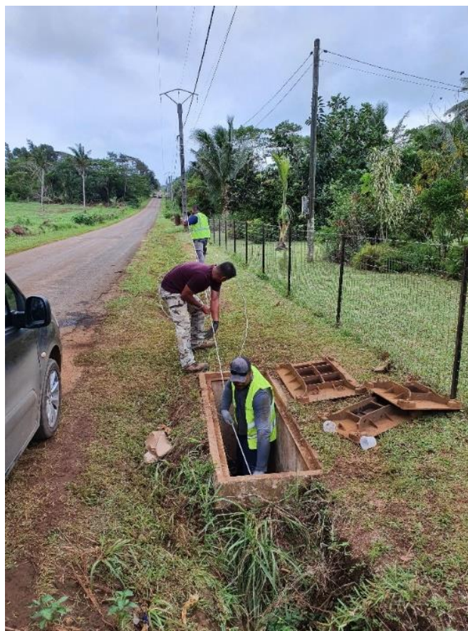
Les techniciens ont tiré 4 km de fibre pour raccorder l'hôpital de Sia.