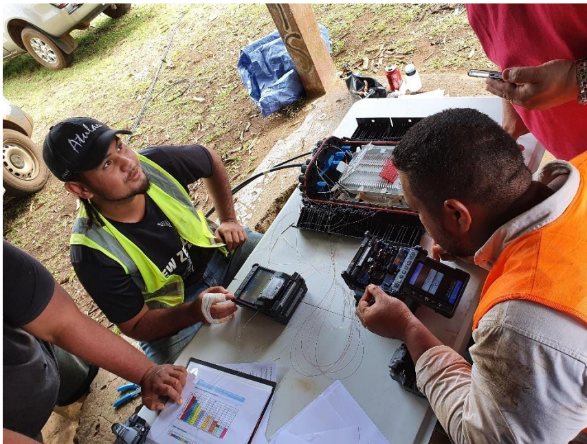
Formation des techniciens du SPT-WF à la soudure d'une boîte de raccordement fibre optique.